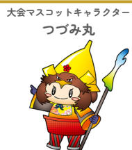
大会マスコットキャラクター つづみ丸