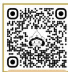
公式ウェブサイト