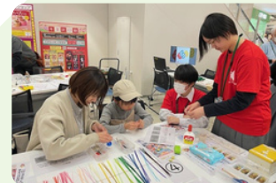
「2027いしかわ総文」生徒実行委員会の様子